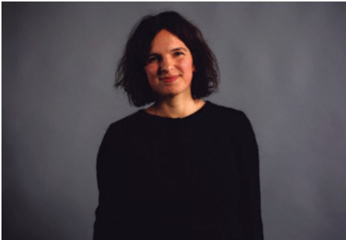
Soledad Gutiérrez