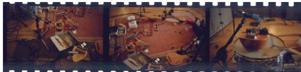
Imatge cortesia de Luke Fowler i Richard Youngs

Richard Youngs ha conviscut amb la música tota la vida. Va descobrir el poder de la forma artística aporrintant el piano familiar quan era un nen enrabiad de cinc anys. Durant els 45 anys següents, ha intentat utilitzar el mateix poder experimental, lúdic i ingenu en els seus directes i en les seves 140 gravacions. Adoptant tècniques d'enregistrament de guerrilla, es regeix per l'ètica independent del D.I.Y. Procura no repetir-se i cada vot de confiança és una expressió del seu caràcter essencialment jove ( Youngs-ness ).