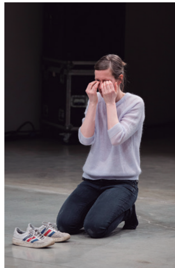
Mette Edvardsen, No Title , 2014.

mai. Reflexiona sobre què és i com es crea una peça, què pot fer, per a què serveix, quins són el seu poder i els seus límits; sobre l'abisme entre el món i les idees que en tenim, l'abisme insalvable entre el pensament i l'experiència, entre l'aquí i l'allà. No Title és una escriptura en l'espai, una escriptura que és alhora additiva i sostractiva. És una escriptura que traça i esborra, que avança i s'atura, que es fixa en coses que no hi són i recupera allò que ha omplert el buit que han deixat.