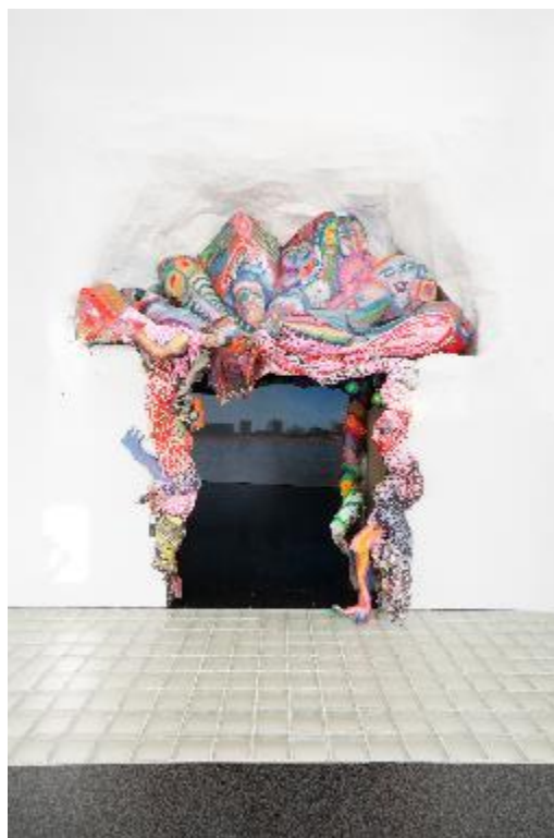
La Meiers , 2021, Antoni Hervàs

Un imponent portal de paper maché d' Antoni Hervàs , inspirat en el joc de taula El Chino (ambientat al barri del Raval) i en la història del Teatre Arnau, convida a submergir-se en l'exposició. Inaugurat el 1894, aquest teatre mític es va convertir en una de les sales de varietats i cabaret més populars de Barcelona. Actualment es troba en procés de reforma estructural gràcies a un moviment social que n'ha promogut la recuperació. L'obra d'Hervàs al MACBA està connectada amb un gran mural de 24 metres situat davant del mateix teatre, una crònica homenatge als bars i teatres, d'abans i d'ara, del Paral·lel. A continuació ens dona la benvinguda Theatre of Doubts (2021), que reuneix 49 pintures de l'univers al·legòric i pictòric de Rasmus Nilausen i s'inspira en el teatre de la memòria de Giulio Camillo. Aquest filòsof renaixentista va invertir la perspectiva del teatre clàssic situant l'espectador a l'escenari central, amb vistes a set files de set imatges en un intent (fallit) de representar la totalitat del coneixement humà i el cosmos.