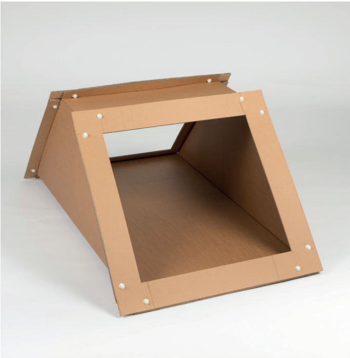
Charlotte Posenenske, elemento de Vierkantrohre Serie DW, 1967. Cortesía Estate of Charlotte Posenenske, Mehdi Chouakri, Berlín, Peter Freeman, Nueva York, y Take Ninagawa, Tokio.

Exposición del 18 de octubre de 2019 al 8 de marzo de 2020