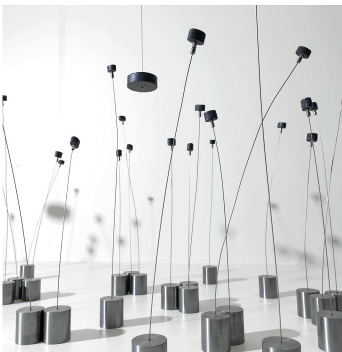
Takis, Magnetic Fields (detall), 1969. Solomon R. Guggenheim Museum, Nova York. Donació parcial, Robert Spitzer, per intercanvi, 1970. © ADAGP, París i DACS, Londres 2019.

Exposició del 22 de novembre de 2019 al 19 d'abril de 2020