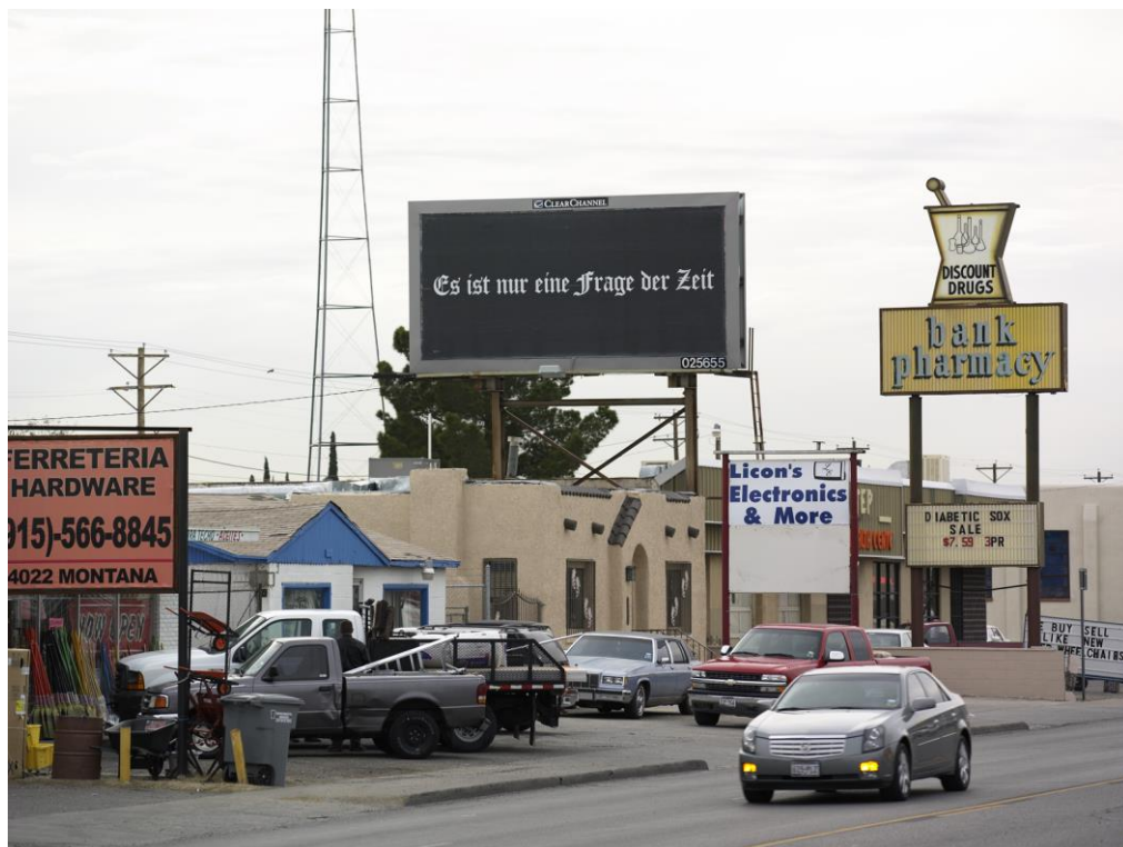
Felix Gonzalez-Torres "Untitled" ( It's Just a Matter of Time ) 1992