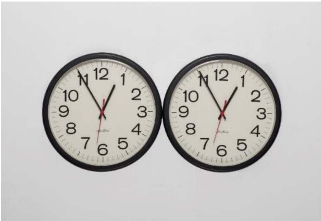
Felix Gonzalez-Torres "Untitled" (Perfect Lovers) 1987-1990