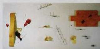
▲ Escritura en una Rengua que es mar, 2000 (140 x 300 cm)