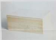
▲ Pla de papers signats al ferro, 1967-1968 (5,8 x 13 x 10,5 cm)