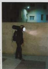
De l'obra: 2002

La trajectòria artística de Perejaume (Sant Pol de Mar, 1957) està marcada per la vocació literària i la força autònoma del paisatge, tant en la seva dimensió natural com cultural. Pintures, objectes, instal·lacions, fotografies, teatre o literatura esdevenen un mateix rastre de la seva particular escriptura sobre les imatges i les representacions, del qüestionament de la raó visual.