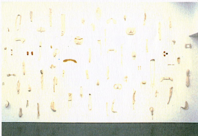
GUILLÉN-BALMES, Ramon Arqueologia d'artista (objets trouvés)