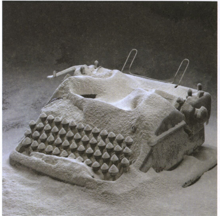
Rheinmetall / Victoria 8, 2003 (detall) © Rodney Graham, 2009

Amb el treball Two Generators (Vancouver, 1984) crea una pionera instal·lació a l'aire lliure, consistent a il·luminar un riu a prop del recinte universitari amb llum produïda per un generador elèctric. Posteriorment durà a terme altres accions d'aquesta mena, com és el cas d' Edge of a Wood (1999), en què la il·luminació sobtada d'un indret determinat enmig de la foscor de la nit permet assolir una percepció més conscient del lloc.