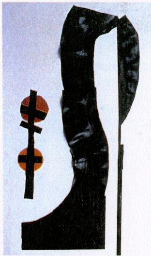
Joan ROM Extremitat