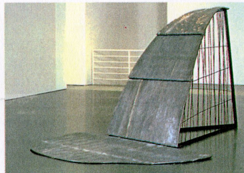
SOLANO, Susana El puente