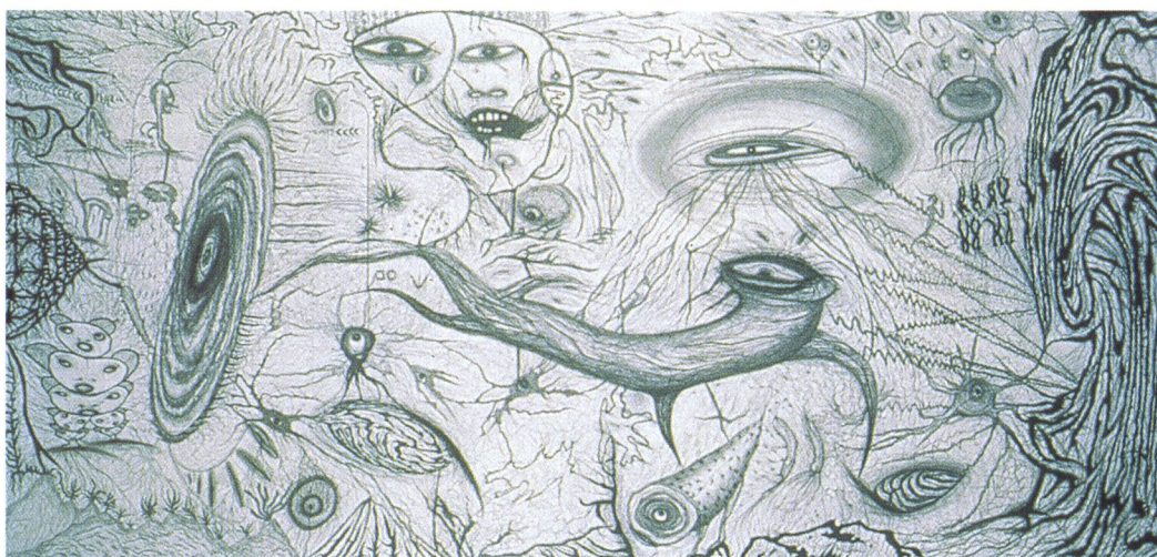
ZUSH. Pulitocs, 1992-1993

Junto a la recuperación de modelos de la pintura, los años ochenta son también un período de radicalización política en el arte, en parte como respuesta a la crisis de la socialdemocracia y del estado del bienestar y al conservadurismo neoliberal. En el ámbito anglosajón, el impacto del sida capitalizó el activismo artístico e introdujo debates sobre las políticas de la identidad y del cuerpo.