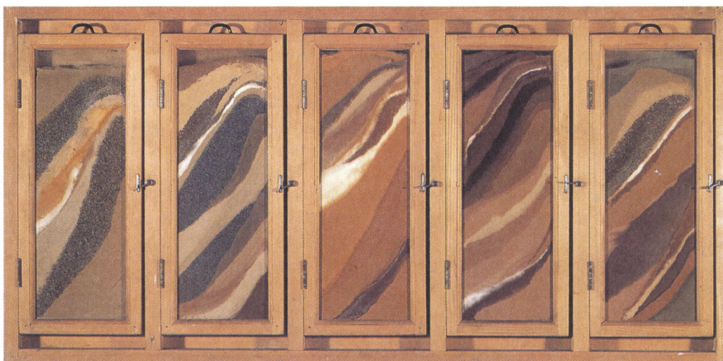
DIETER ROTH. Gewürzkasten [Armario de especias], 1970 Colección MACBA. Fundación Museu d'Art Contemporani de Barcelona

Marcel Broodthaers es un artista fundamental en este período. Su obra reúne dos tradiciones esenciales del arte moderno: la del readymade de Duchamp y la imagen-retórica de Magritte. Aunque arranca de la escritura, su trabajo adopta diferentes medios: fotografía, cine, instalación, grafismo, múltiples, libros, etc. Su obra preludia las