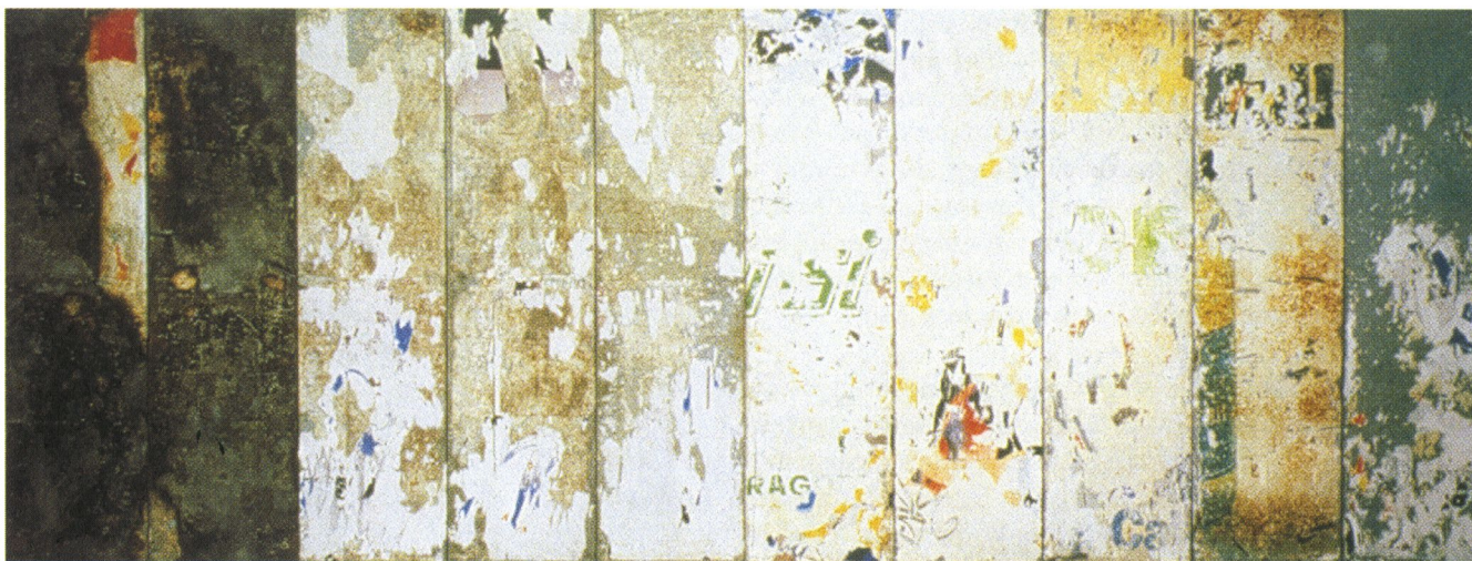
RAYMOND HAINS. Sin título , 1999. Colección MACBA. Fundación Museu d'Art Contemporani de Barcelona