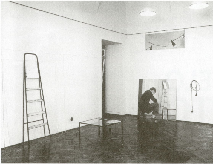
I plexiglas , 1964

tual, però també del minimalisme i les diferents versions de l'art pop. Aquestes pràctiques comparteixen, a pesar de les seves diferències, una voluntat de qüestionar els límits de l'autonomia artística, el que es tradueix en una crítica a l'espai del museu i a la idea de la pràctica de l'art com a producció d'objectes.