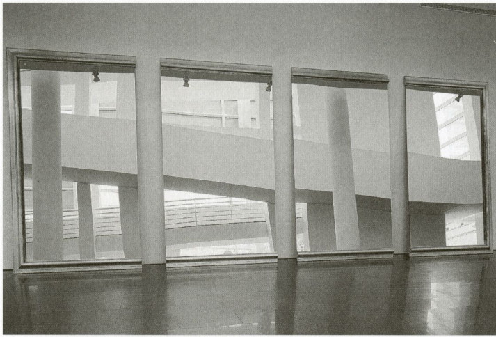
Architettura dello Specchio , 1990

Mirall i fusta daurada. 4 unitats de 300 x 150 cm c/u. Col·lecció MACBA. Fons d'art de la Generalitat de Catalunya.