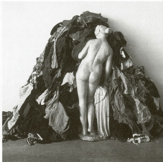
Venere degli stracci , 1967. Marbre de Carrara, gases. 230 x 200 x 100 cm