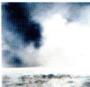
Fragments de mar (ona) (234), 1969. Col·lecció particular

L'obra de Richter es resisteix a la idea d'estil. De fet, en un primer moment va decidir abandonar el sistema discursiu de la pintura del realisme socialista, en favor d'una concepció de la pintura que s'apropiava manifestament de l'univers plàstic del periodisme fotogràfic i de la fotografia amateur. En la seva opinió, conceptes com realisme, conceptualisme o abstracció no són exclusius sinó que es consideren procediments alternatius. Així, ell mateix ha qualificat parts de la seva obra com a "figuratives", "constructives", "abstractes", en funció del procediment específic utilitzat. La seva obra va des de la reproducció de la realitat basada en un model fotogràfic fins a les abstraccions monocromes grises, des de l'ús de miralls i plafons pintats de forma mecànica fins a pintures gestuals, des de l'escultura fins a quadres expressius abstractes.