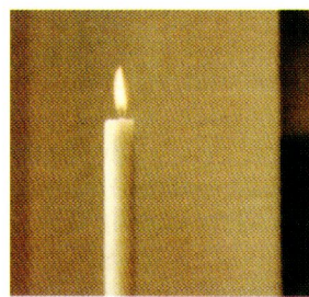
Espelma (511-1), 1982. Oli sobre tela. IAC, Col·lecció Frac Rhône-Alpes. Villeurbanne

¿Quins són els criteris que utilitza Richter per seleccionar, entre totes les imatges possibles, les que passaran a formar part del seu gran arxiu personal, l' Atlas i que, per tant, seran susceptibles de ser traslladades a la pintura?