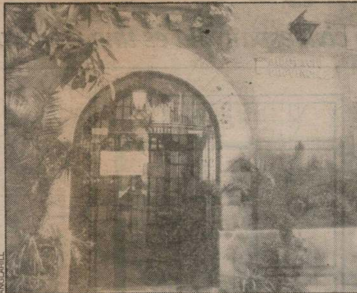
La Diputació de Barcelona ha habilitat un edifici històric del carrer d'Elisabets per a centralitzar l'organització d'Inter-acció-84