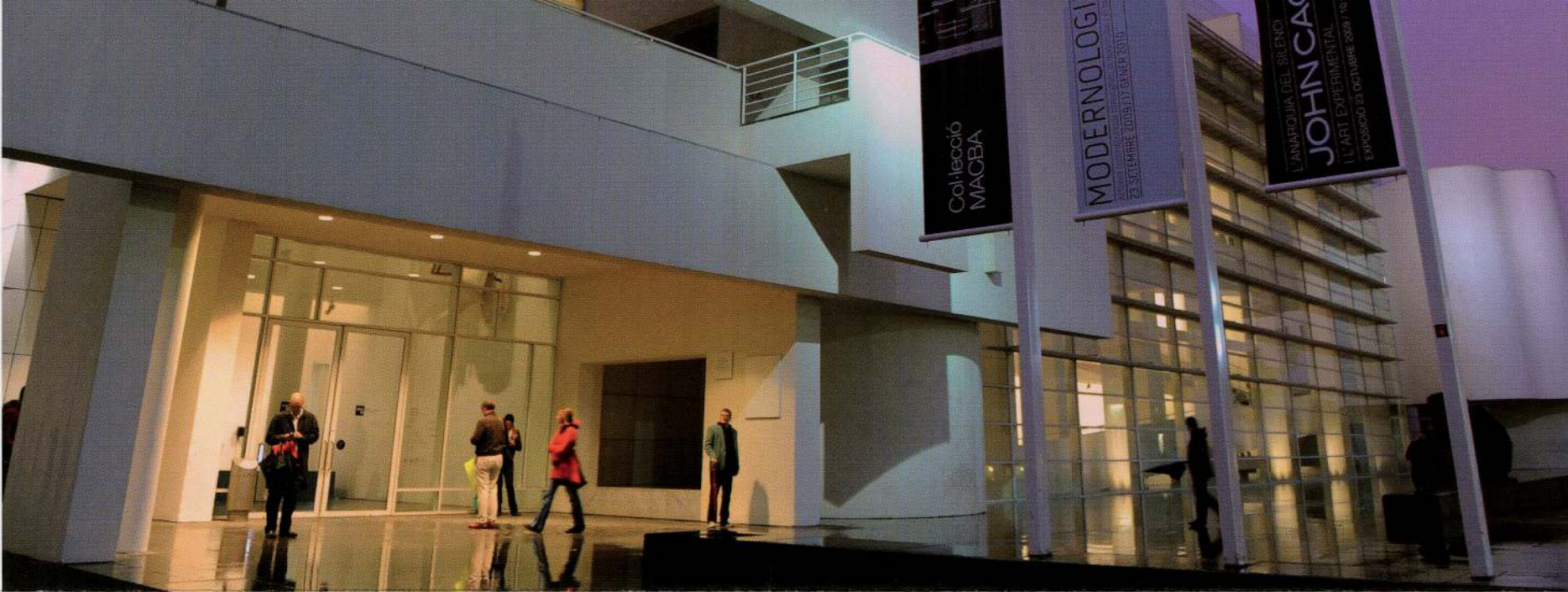
Museu d'Art Contemporani de Barcelona, octubre de 2009, Foto: © David Campos, 2010