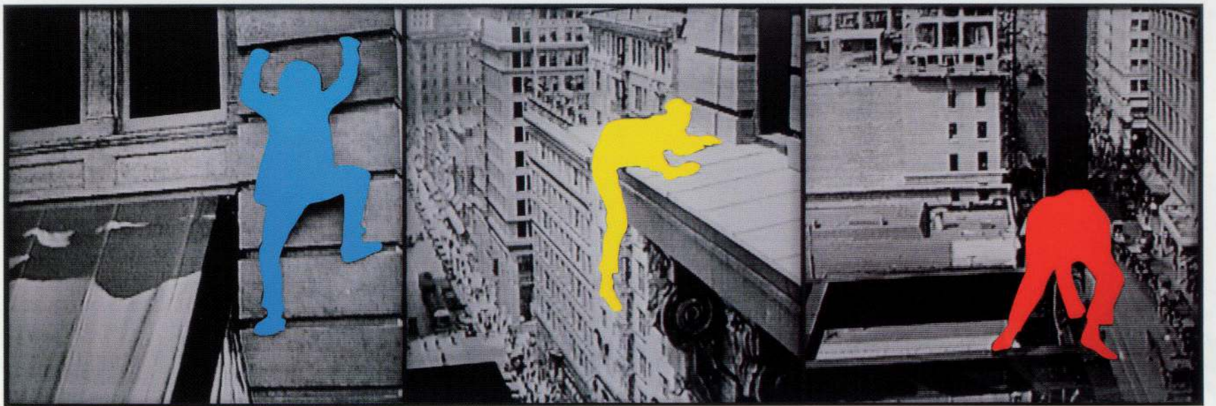
John Baldessari, The Duress Series: Person Climbing Exterior Wall of Tall Building / Person on Ledge of Tall Building / Person on Girders of Unfinished Tall Building , 2003. © John Baldessari, 2010 Cortesia de l'artista i Marian Goodman Gallery, Nova York i Paris