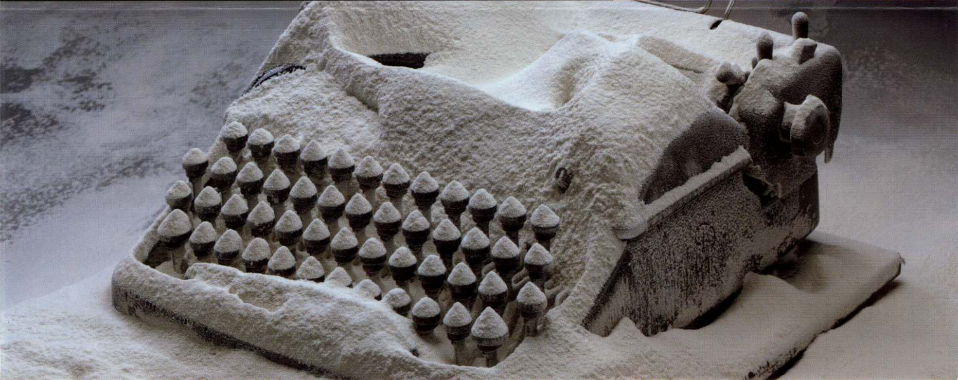
Rodney Graham, Rheinmetall / Victoria 8 , 2003 (detail). © Rodney Graham, 2010