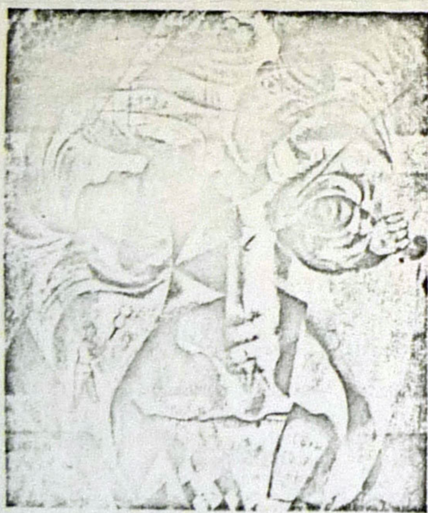
Obra de Norman Norotzky.

Chagall —según recuerda Alberto del Castillo en el cuidado catálogo de la exposición— vino a Tossa cuando por los años treinta se reunían en este pueblo escritores y artistas nacionales y extranjeros, al reclamo que establecían, entre otros, Rafael Benet y Pedro Creixams. Se