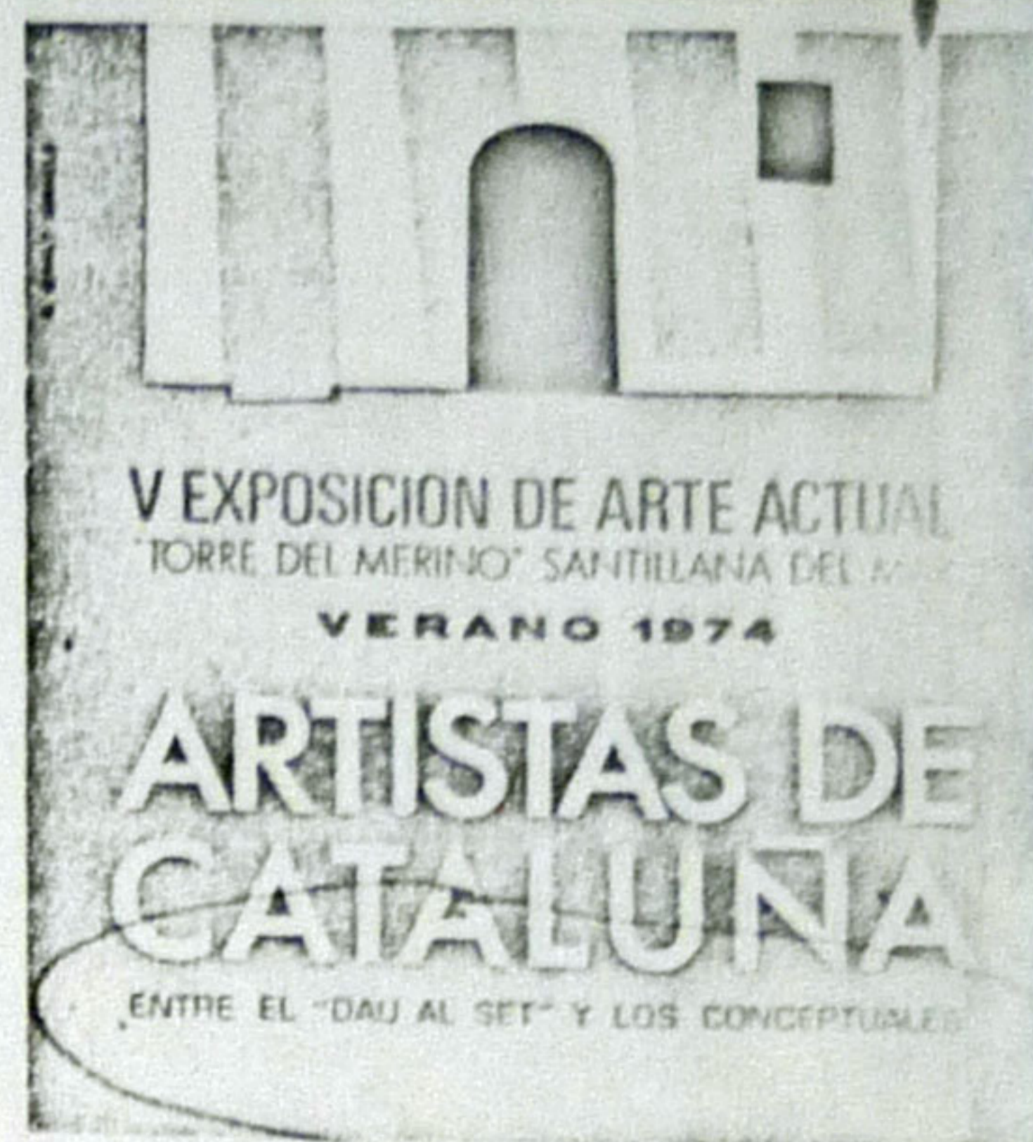
ARTISTAS DE CATALUÑA EN SANTILLANA DEL MAR