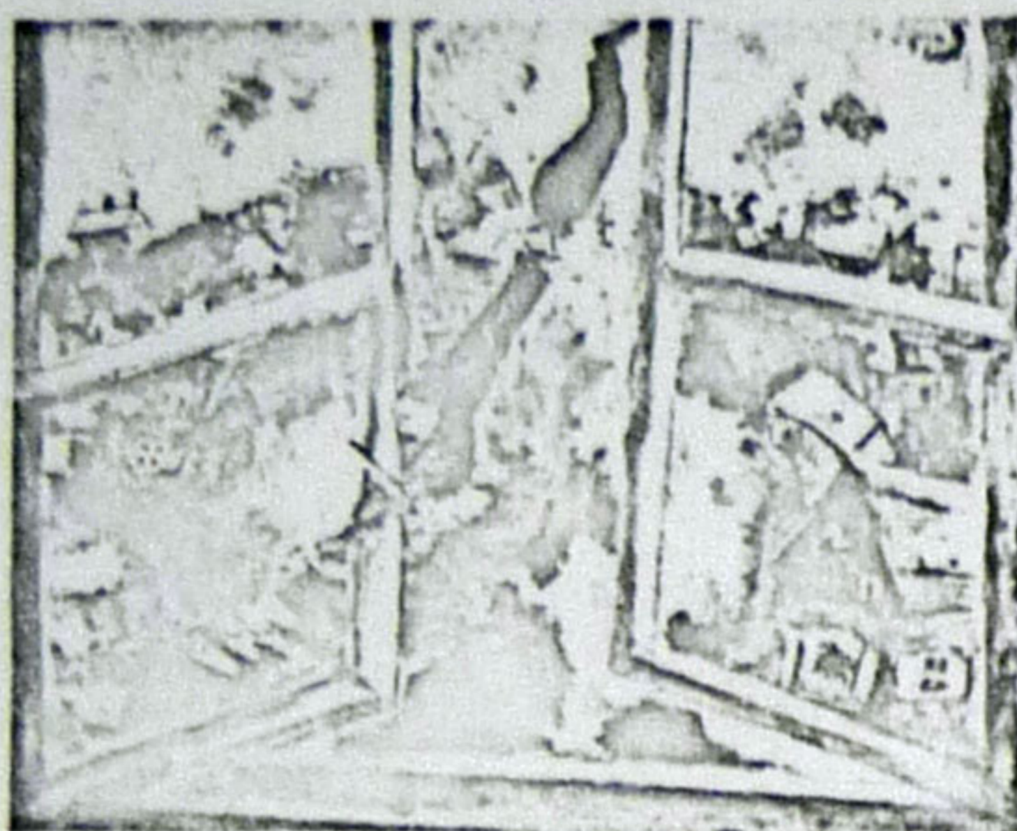
La única obra que se conserva de Marc Chagall en Tossa de Mar.

Hace unos días se inauguró en Sant Pere de Galligans, Gerona, la exposición de la totalidad de las obras presentadas al concurso: folleto de orientación, catálogo cuidado y un excelente y pensado montaje de las maquetas. De ello se hablará más adelante.