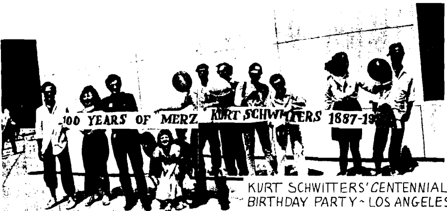
KURT SCHWITTERS' CENTENNIAL BIRTHDAY PARTY - LOS ANGELES MUSEUM OF ART. JUNE 20 1987