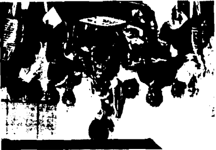
FRIGENTLY, IT CANNOT BE BOUGHT! (THANK GOD!) EDITOR: CREATIVE THING-REPORTER: MICHAEL MOLLETT • EVENT ORGAN- IZER: RICHARD MEADE • COVER BILLBOARD CREATED IN MINDEN, WEST GERMANY BY H. R. FRICKER SPIRIT OF HONOR: KURT SCHWITTERS

ASSOCIATE OF THE ROYAL PHOTOGRAPHIC SOCIETY OF GREAT BRITAIN EXCELLENCE DE LA FEDERATION INTERNATIONALE DEL'ART PHOTOGRAPHIQUE