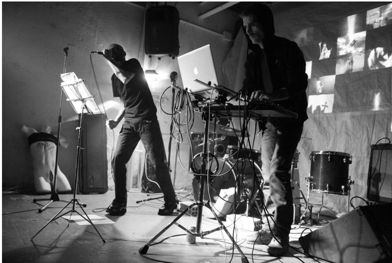
BIG BOUNCE (SITE SPECIFIC) , Danza. 26 octubre