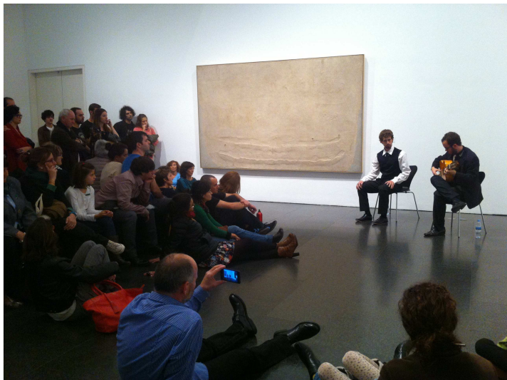
PERE MARTÍNEZ CANTA A TÀPIES , Taller de músics, 9 de noviembre