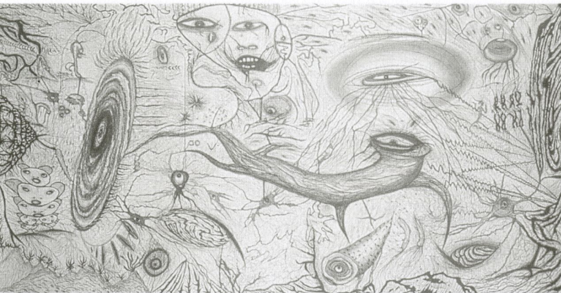
Pulitocs , 1992-1993

Col·lecció MACBA. Fundació Museu d'Art Contemporani de Barcelona