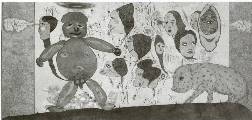
Socjomo. The Girls of my life I , 1986