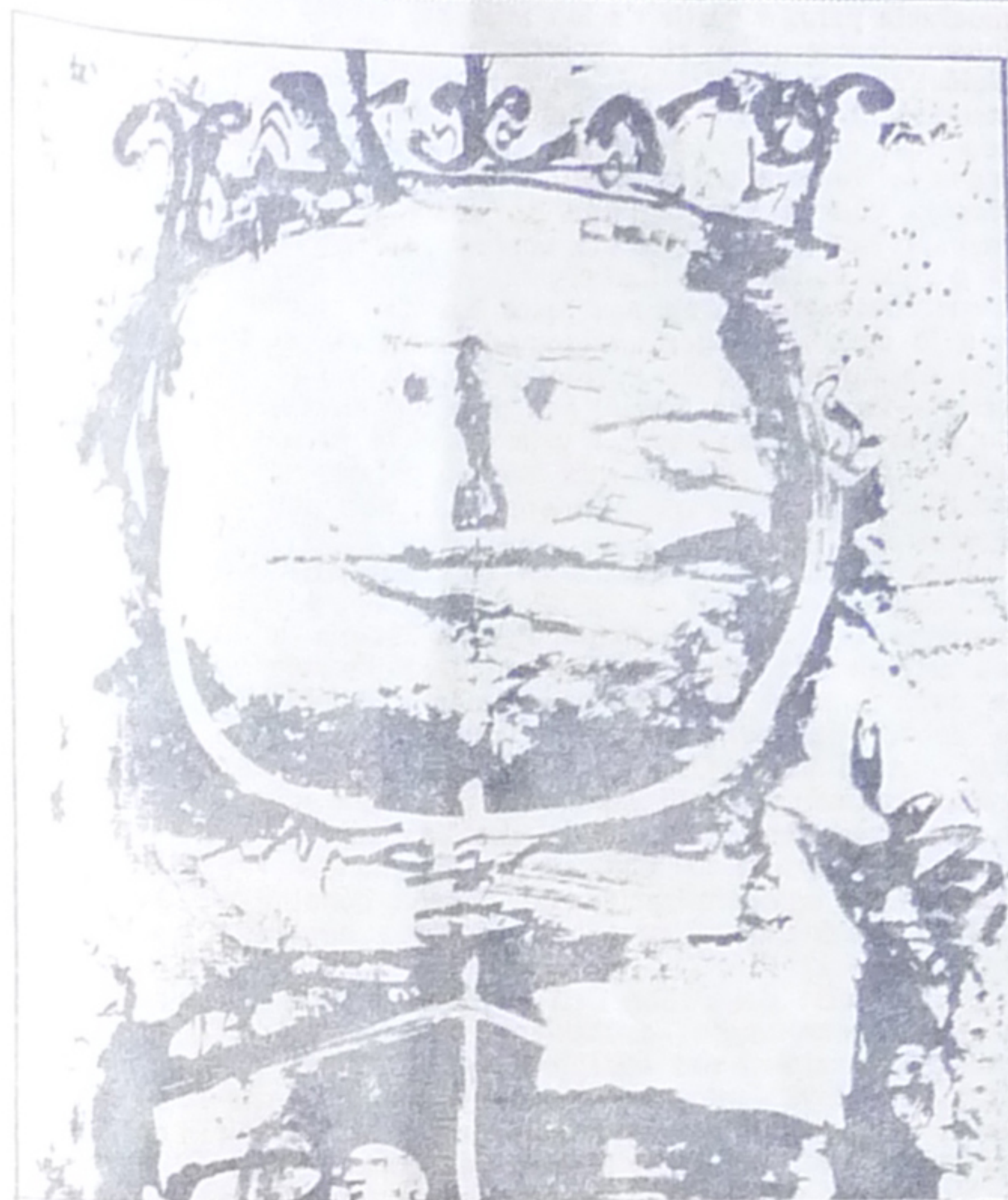
«Le roi», obra de Antoni Clavé vendida por 310.000 pesetas en la última subasta de la firma madrileña Saskia-Sotheby's. Se trata de una guacha con collages que procedía de la Acosta Gallery, de Beverley Hills (California)